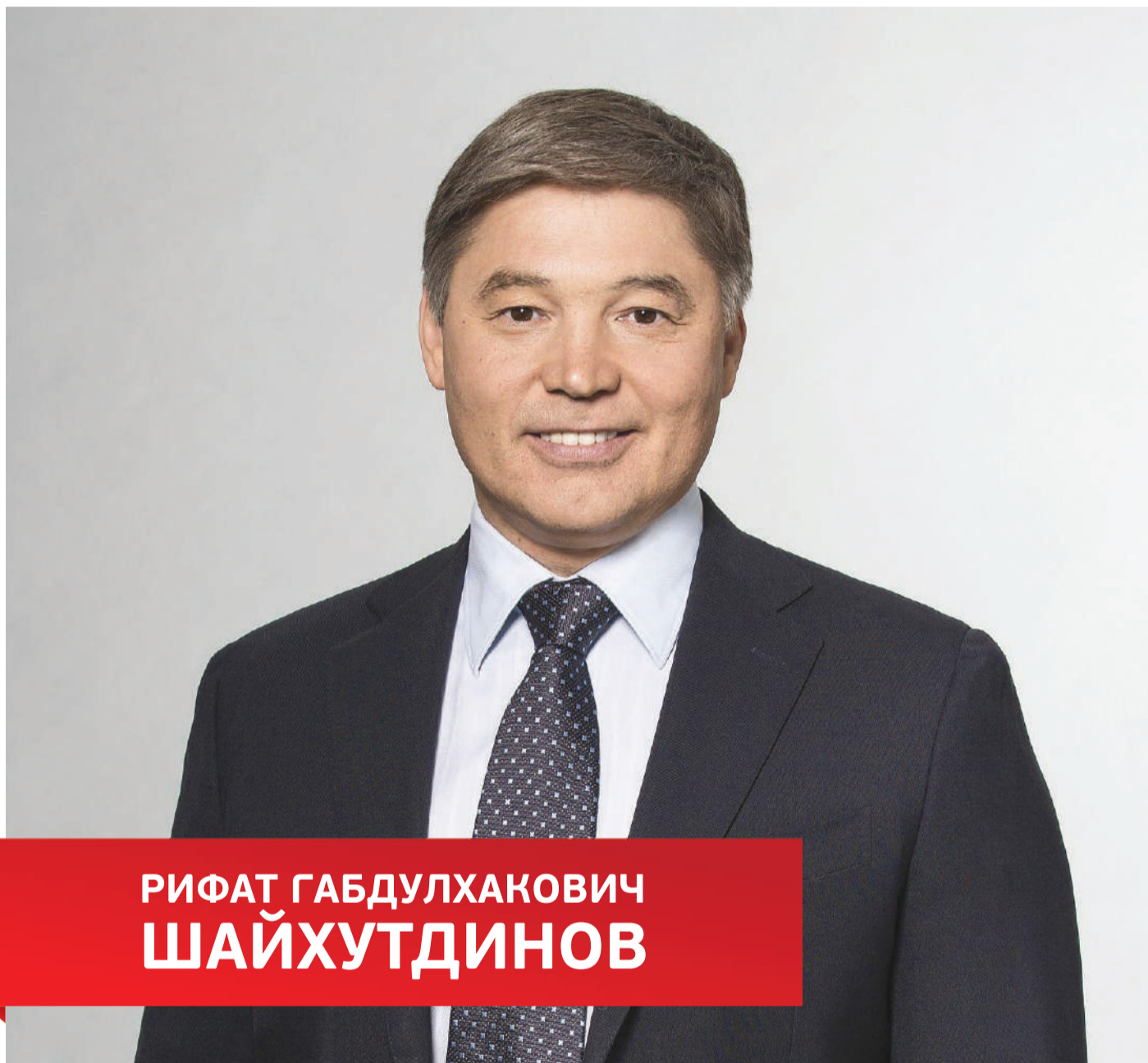
РИФАТ ГАБДУЛХАКОВИЧ ШАЙХУТДИНОВ

ДЕПУТАТА ГОСУДАРСТВЕННОЙ ДУМЫ РОССИЙСКОЙ ФЕДЕРАЦИИ