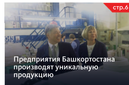
Предприятия Башкортостана производят уникальную продукцию