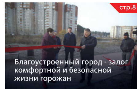
Благоустроенный город - залог комфортной и безопасной жизни горожан