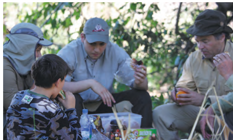
> Охотники на привале.

В Тамбовской области есть река Ворона. Ее берега были излюбленным местом именитых людей. В окрестностях Вороны стояли усадьбы художника Поленова, композитора Рахманинова, поэта Баратынского, философа Чичерина. Сегодня эти поместья разграблены и разрушены. На руины часто набредают одинокие охотники и романтики, мечтающие восстановить утраченную красоту. Россия полна подобными памятниками, но никто не хочет, чтобы такие развалины оставались от его дома.