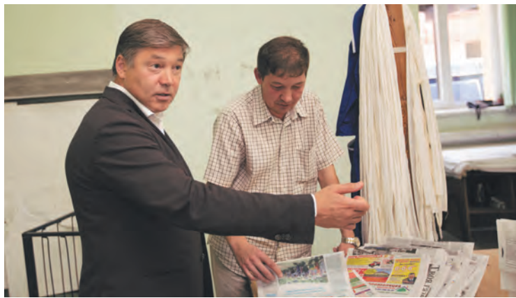
> Визит в Нефтекамский Дом печати.

— Говорить за других сложно, но есть очевидные признаки. Продажа «фанфуриков» процветает, потому что есть спрос. Люди пьют от безысходности. Они не понимают, ради чего они живут. Те, у кого есть