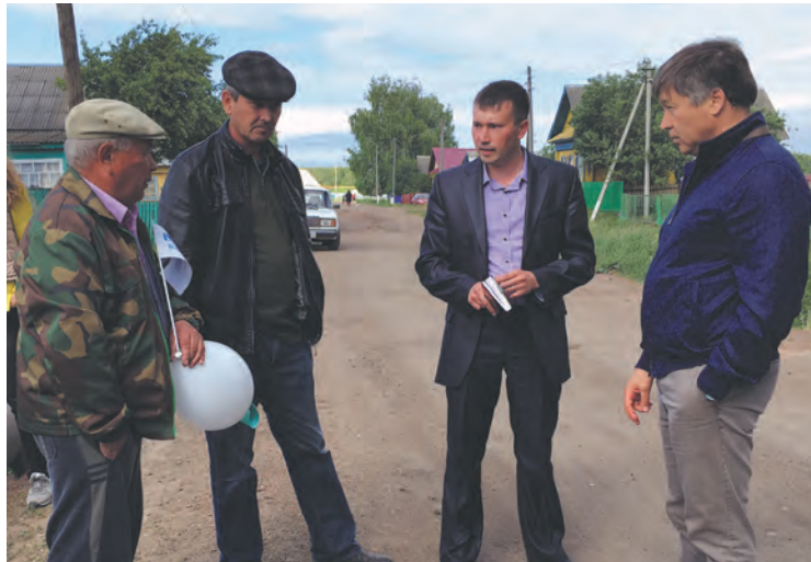
> Осмотр переправы в селе Карманово Янаульского района.

работа и семьи — двигаются и выживают. Остальные — спиваются или уезжают искать смысл в других местах. Четкого плана, как это остановить, пока никто не озвучил.