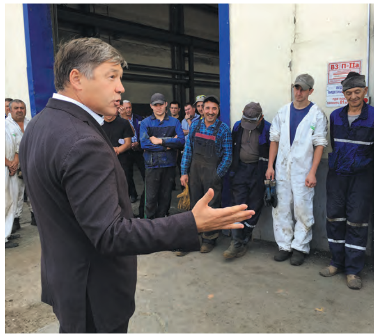
➤ Встреча с рабочими «Нефтегазстрой».

— Я учился и работал по всей стране и за ее пределами. От Сахалина и до Киева, от Краснодарского края и до Санкт-Петербурга, Забайкалье, Урал, Украина, Киргизия. Везде я занимался развитием территорий и решал проблемы жителей. Моя политическая карьера началась в 2003 году, я был депутатом двух созывов Государственной думы и отлично представляю, что нужно делать, чтобы сдерживать свои обещания. Поэтому и обещаю я аккуратнее всех.