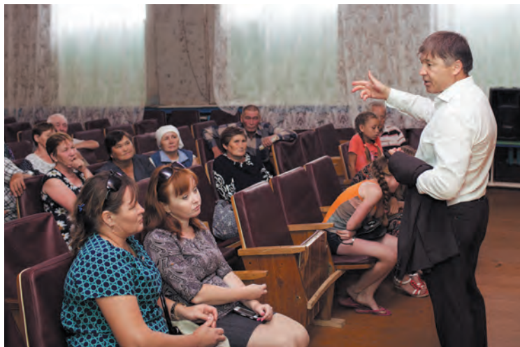
> Общение с жителями села Большой Кельтей Калтасинского района.

— В этот раз был в роли болельщика и с удовольствием поздравил победителей в скачках и борьбе куреш. Как спортсмен, я понимаю, насколько важно поддерживать спорт. Он воспитывает уверенность в себе, волю к победе. Приятно, что округ живет спортивной жизнью.