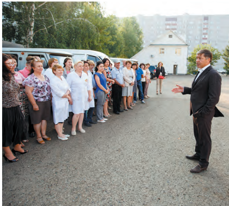
➤ Встреча с коллективом «Нефтекамскводоканал».

библиотек. Одной из самых содержательных стала встреча в Нефтекамской городской больнице. Обсудили с врачами пресловутую оптимизацию. В районах закрываются отделения, лаборатории, сокращаются фельдшерские пункты. Врачи понимают, что главная проблема — страховая медицина. Понимают, что государство отказалось от заботы о здоровье людей и отдало медицину на откуп страховым компаниям, которые живут финансовым интересом, наживаются на наших болезнях.