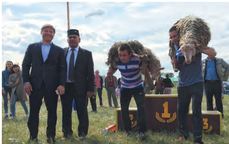
> Сабантуй в селе Верхнеяркеево Илишевского района, награждение батыров, июнь, 2016.